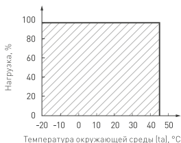
Рис. 3. Максимальная допустимая нагрузка, % от мощности источника