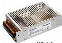
ARS-150 ARS-200 ARS-250