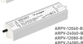
ARPV-12060-B ARPV-24060-B ARPV-12080-B ARPV-24080-B