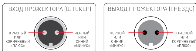
Цоколевка коннекторов на кабелях питания