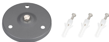
Рис. 2. Основание для установки на поверхность (ALT-BASE-R75, арт. 024890)