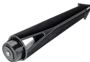
Рис. 3. Основание для установки в грунт (ALT-SPIKE-175, арт. 024888)